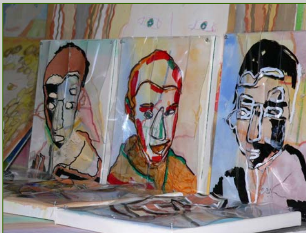
Préparation de l'exposition sur le thème du portrait