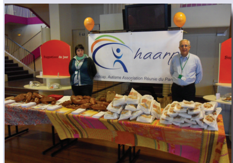
Dassault Argenteuil - 26 novembre 2013