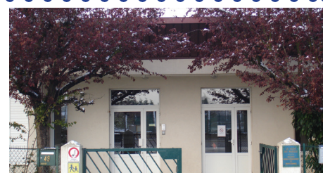
IME Le Clos du Paris

L'Association a reçu l'accord des Services Techniques de la ville pour la réalisation des travaux d'extension de 10 m 2 du studio existant à l'arrière du pavillon. Le chantier doit démarrer prochainement.