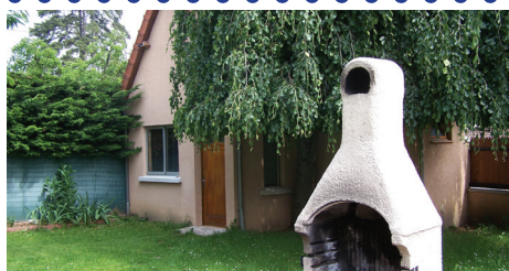
SAVS La Montagne

De nouvelles réunions se sont tenues avec VOH (Val d'oise Habitat). Des visites ont eu lieu dans divers foyers de vie afin de comparer les modes de fonctionnement et les configurations architecturales.