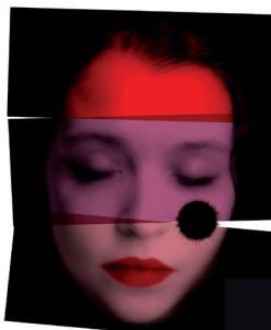
BLANCHE NEIGE FESTIVAL DU FUTUR COMPOSÉ AUTISME & CULTURE DU 24 AU 29 JUIN