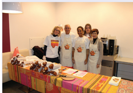
Sagen Eragny - 21 novembre 013