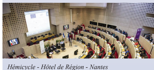
Hémicycle - Hôtel de Région - Nantes

L'IME Le Clos du Parisis a gagné, dans le cadre du projet COMENIUS , le trophée de l'Agence Européenne Catégorie public en difficulté.