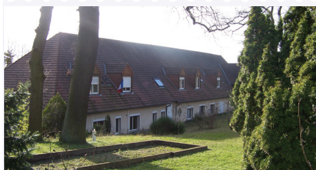
Foyers Le Grand Cèdre

d'OPC (Ordonnancement, Pilotage et Coordination) et de serrurerie défectueuses ont été remplacées. Le nouvel OPC a refait un nouveau planning et les réunions de chantier reprennent activement.