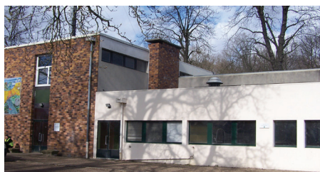
ESAT La Montagne