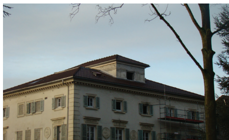
FAM La Montagne - Le Château

Les divers points conflictuels, malfaçons, retards et défections d'entreprises sont confiés à notre avocat afin de lancer une action globale en référé. Les problèmes survenus lors de la réfection de la toiture et de l'abaissement du belvédère sont réglés. Les Sociétés