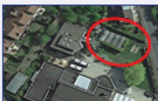
IME Le Clos du Parisis

Regroupement de la Maison de Magny et de la Haie Vive