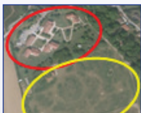
Etablissement du Vexin

Rénovation - reconstruction de l'ensemble sur site sur 2 terrains