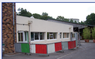
ESAT La Montagne

Construction d'un bâtiment pour l'accueil de classes et ateliers