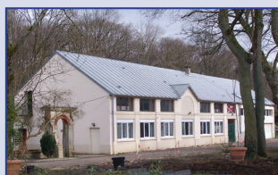
Siège - Aménagement de la salle des fêtes en bureaux

Suite au désengagement de Val d'Oise Habitat, l'HAARP a recontacté le bureau d'architectes Archival. Cette nouvelle collaboration doit, suivant l'analyse des besoins de 2015, aboutir prochainement à la présentation d'un avant-projet architectural qui servira de base de travail. L'éventuelle acquisition du terrain Martinprey impose de l'inclure dans le projet de financement global.