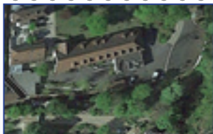
Le Grand Cèdre