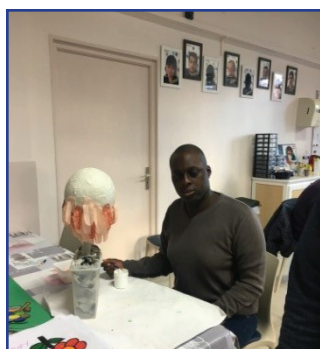
Collage des plumes sur la boule de papier