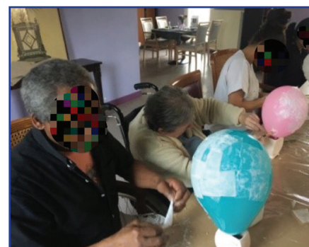
Avec les résidents de l'EHPAD