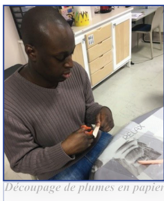
Découpage de plumes en papier

L'atelier « Art créatif » intervient également une fois par semaine au sein de l'EHPAD de Chars. Ce temps d'activité permet aux résidents du FAM et de l'EHPAD se faire connaissance, de se rencontrer et de travailler ensemble autour de la réalisation d'un projet commun.